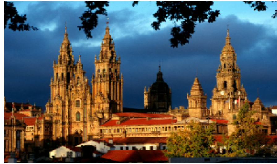
Santiago de Compostela, Espagne